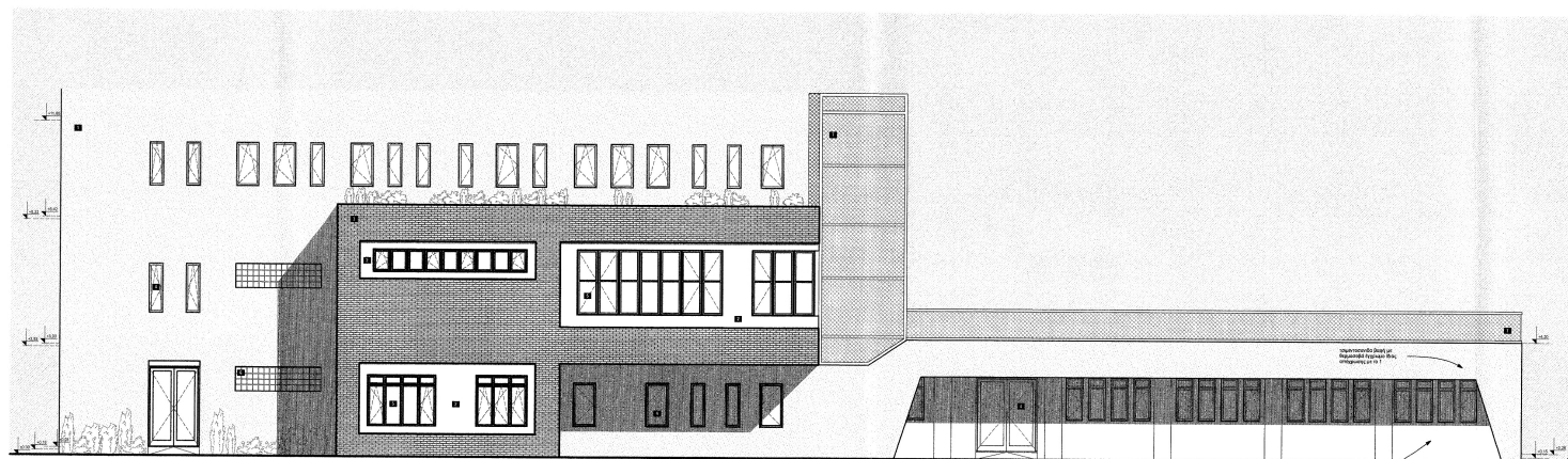
ΟΨΗ ΑΠΟ ΑΥΛΕΙΟ ΧΩΡΟ-ΝΟΤΙΟΔΥΤΙΚΗ ΟΨΗ